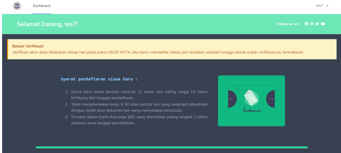
Gambar 1. Halaman Utama User (Bagian 1)

berisikan cara dan petunjuk untuk melakukan pendaftaran hingga pengambilan perlengkapan calon siswa baru.