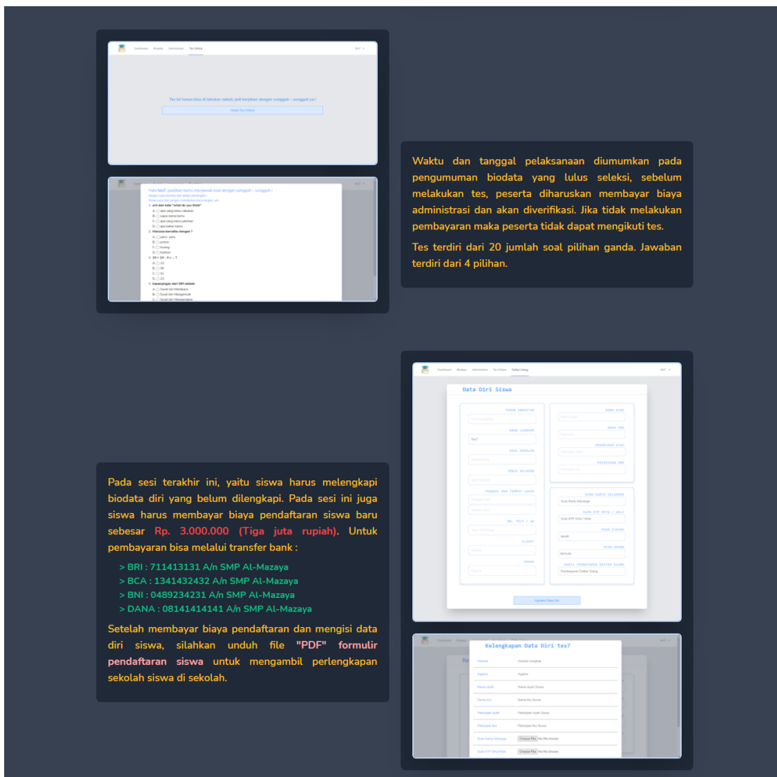
Gambar 3. Halaman Utama User (Bagian 3)